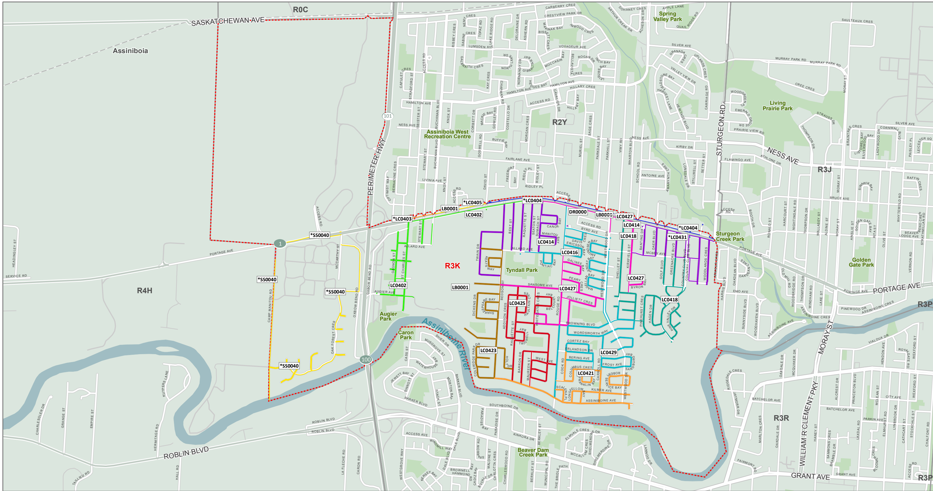
FSA Map Carte de RTA

The Delivery Mode names that have an asterisk (*) indicate Modes that are split between more than one (1) FSA. Les noms des modes de livraison avec un astérisque (*) indiquent des modes partagés entre plusieurs RTA.